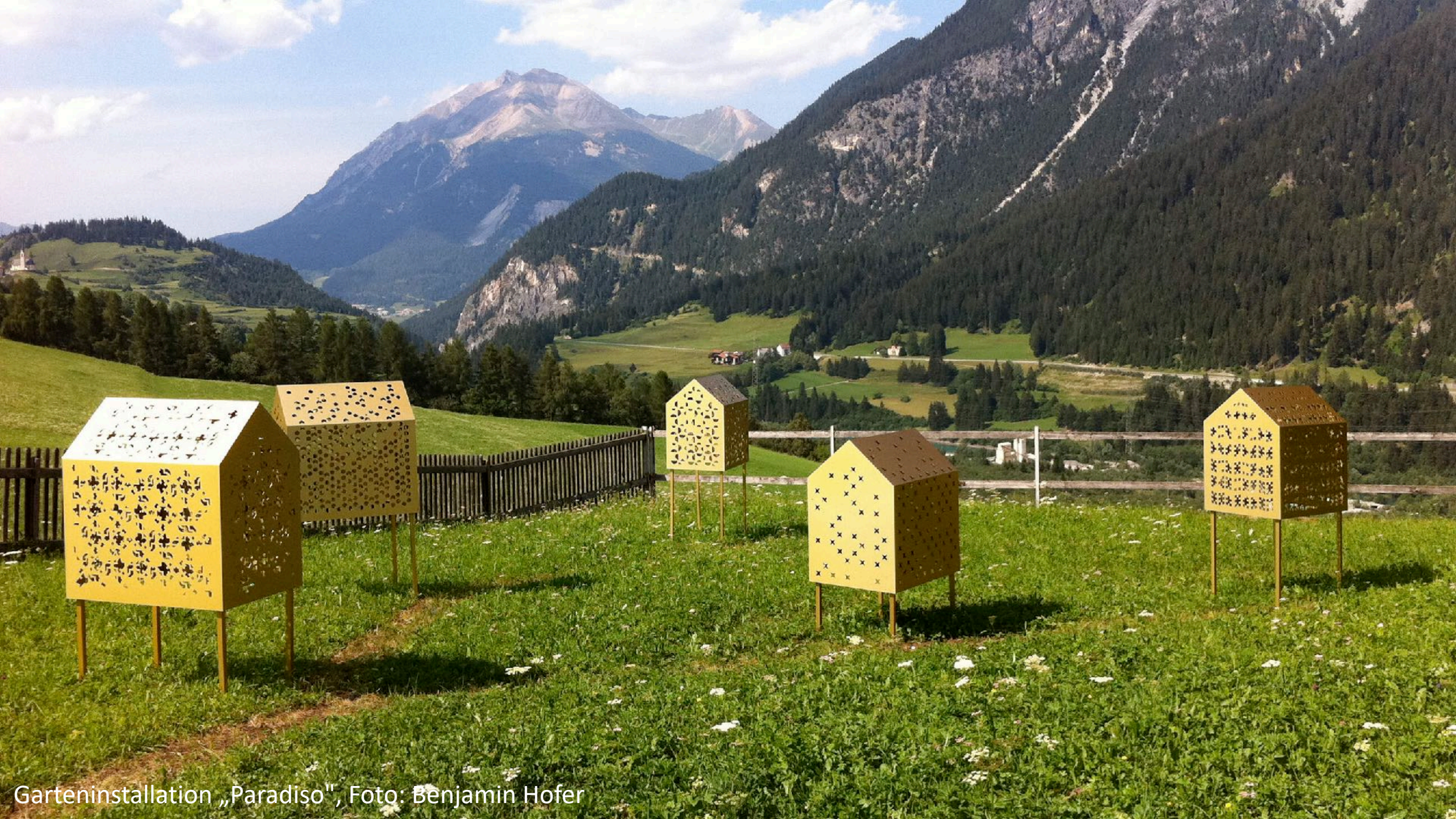
Garteninstallation „Paradiso“