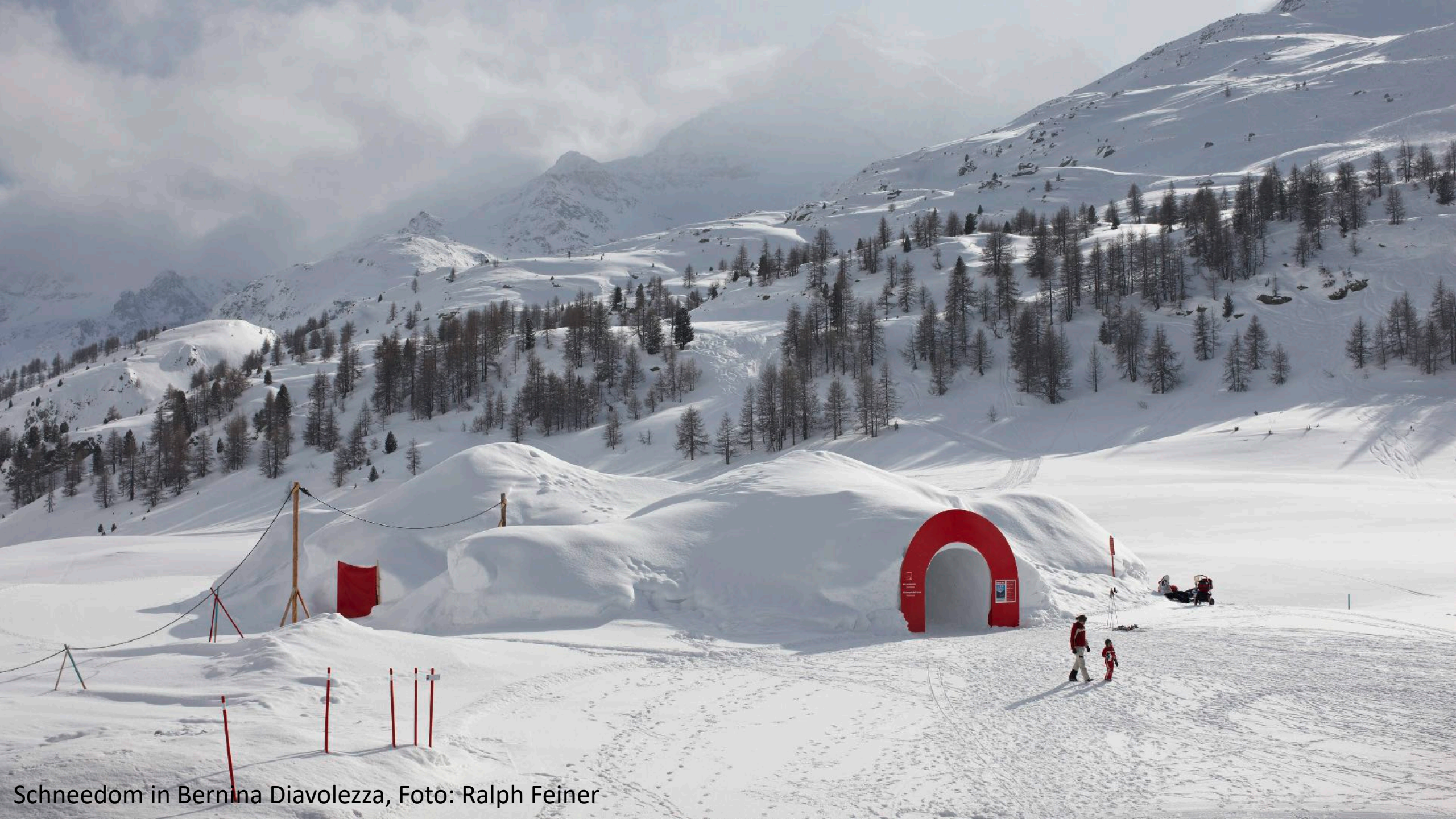
Schneedom in Bernina Diavolezza, Foto: Ralph Feiner