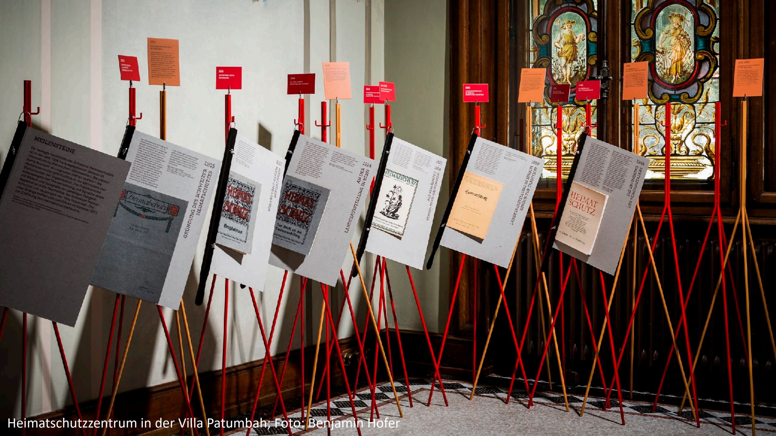
Heimatschutzzentrum in der Villa Patumbah