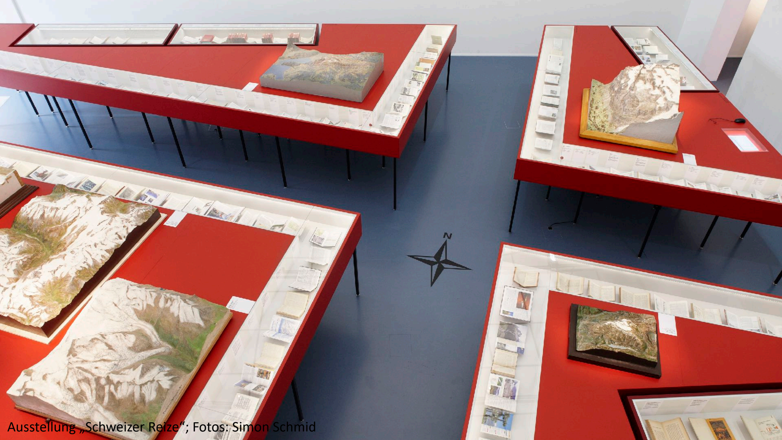
Ausstellung „Schweizer Reize“; Fotos: Simon Schmid