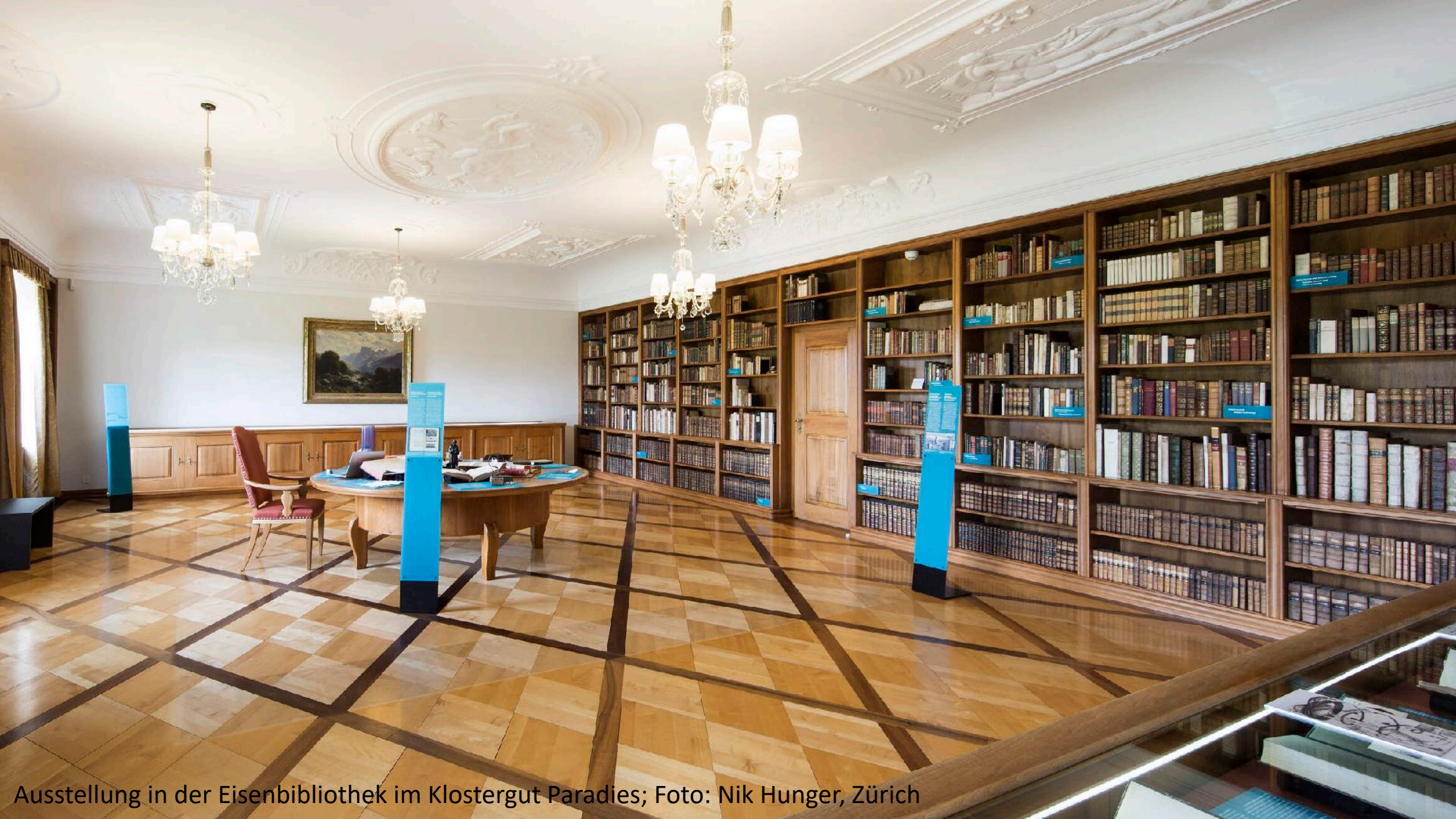
Ausstellung in der Eisenbibliothek im Klostergut Paradies; Foto: Nik Hunger, Zürich