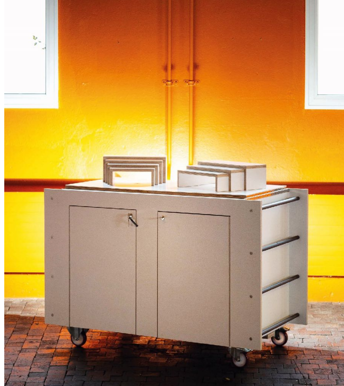
Saurer Museum Arbon