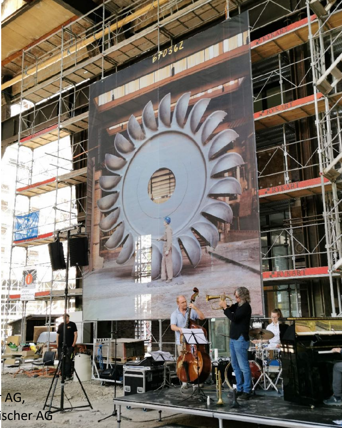
Tag des Denkmals, Georg Fischer AG, Foto: Konzernarchiv der Georg Fischer AG