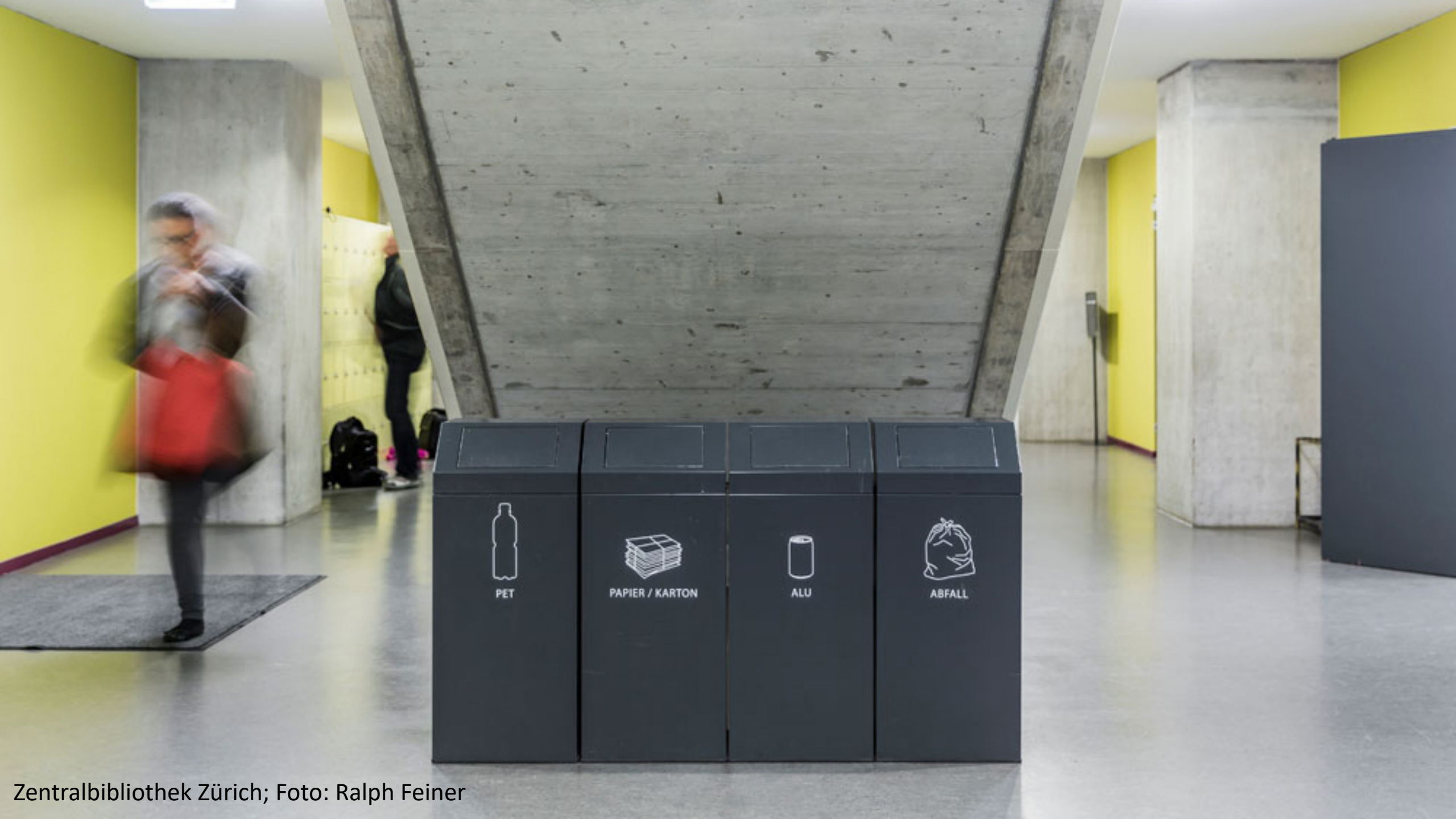
Zentralbibliothek Zürich; Foto: Ralph Feiner